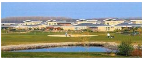
Bewonersvereniging Flevo Golf Resort