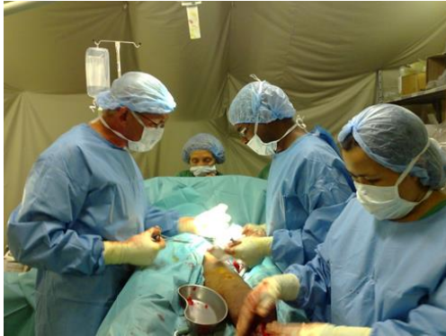
Opereren in een nood OK in Sri Lanka, voor "Tamils tigers" probleem

Somalië mocht niet ontbreken. Central Africa, Yemen, Sri Lanka, Yemen etc.etc.