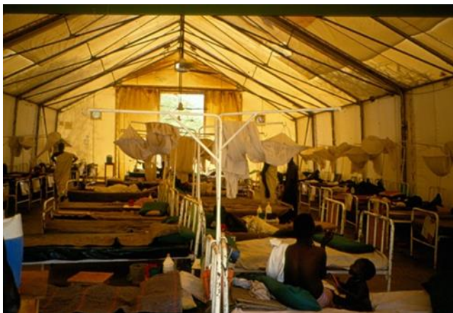
Tent ziekenhuis voor Soedanese conflict

Terug naar het ziekenhuisje van het Rode Kruis op de grens van Sudan en Kenya.