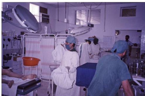
eerste maal Afghaans conflict

Dit leven bracht hem in vele brandhaarden van de wereld en bracht hem in contact met mensen met voor ons afwijkende normen en waarden