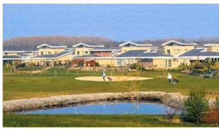
Bewonersvereniging Flevo Golf Resort

ontwikkelingen bestaat draagvlak om te komen tot een gedragen oplossing. Kijk daarbij specifiek naar: