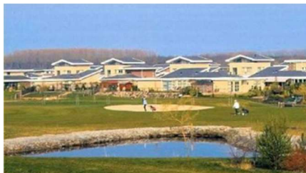
Bewonersvereniging Flevo Golf Resort

opgezegd. Door een groep van trouwe leden wordt de vereniging, in afwachting van een ander perspectief, gecontinueerd. De facto is de Golfclub op dit moment het 'leidende en het lijdende voorwerp'. Het moet noodgedwongen afwachten.