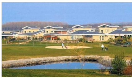
Bewonersvereniging Flevo Golf Resort