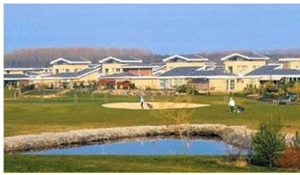
Bewonersvereniging Flevo Golf Resort