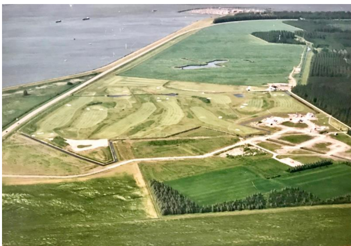
Golfresort nog onbebouwd