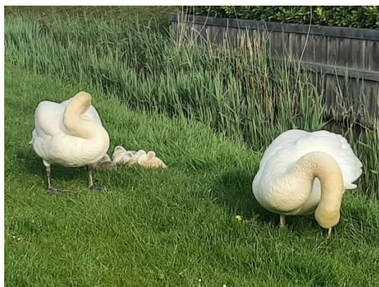
Voorjaar in het Flevo Golf Resort