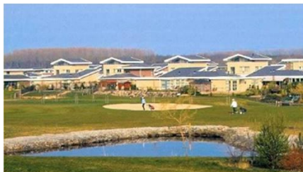
Bewonersvereniging Flevo Golf Resort