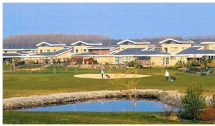
Bewonersvereniging Flevo Golf Resort