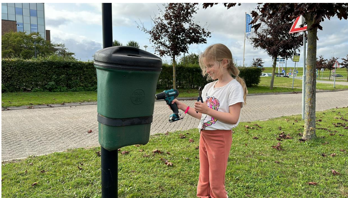
Kleine handen verrichten groot werk

Op het Flevo Golf Resort zijn weer een aantal prullenbakken, voor onder anderen de hondenpoepzakjes, geplaatst. De nieuw geplaatste bakken staan bij de bushalte op de Parlaan en op de Birdielaan in de bocht tussen Birdielaan 38 en 42. Een derde prullenbak zal halverwege de Parlaan worden geplaatst. We zijn als bestuur blij dat bewoners zich (gezamenlijk) hebben aangemeld om de bakken te legen. De BFGR zorgt voor nieuwe vuilniszakrollen zodra deze bijna op zijn.